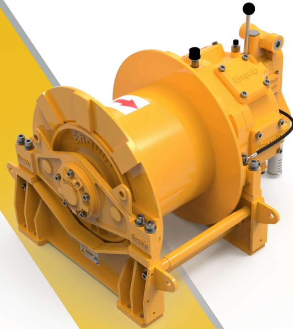
MODELOS DE TAMBOR DRUM MODELS